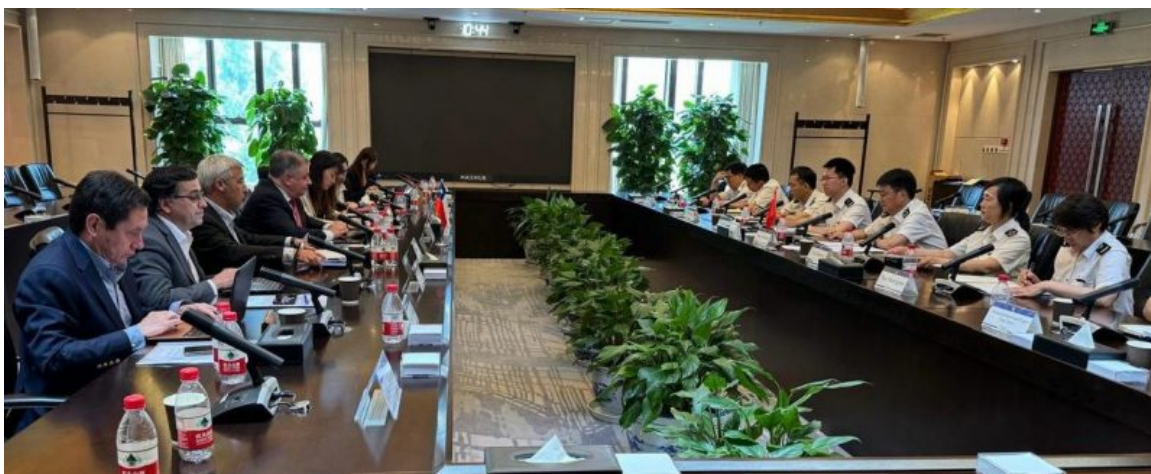
Reunión en la aduana central de Beijing

Al respecto, indicó: “Hemos logrado llegar a algunos acercamientos que nos permitirían trabajar de mejor manera esta nueva temporada, adelantando muchos de los escenarios que se podrían presentar debido a la presencia de un brote de mosca de la Fruta en Chimbarongo, en la Región de O´Higgins”.