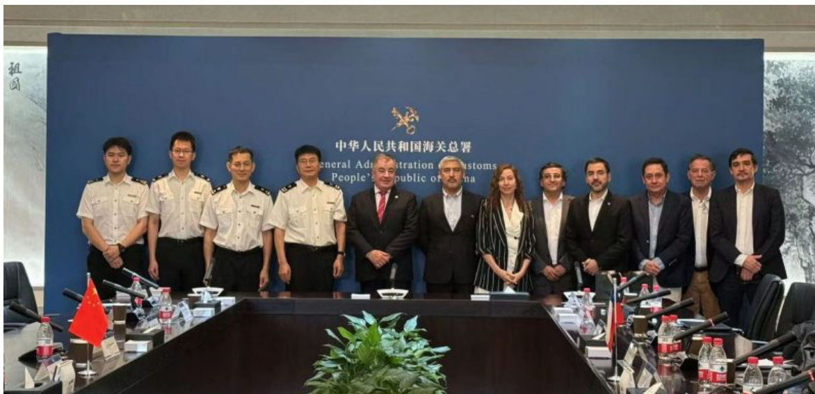
Reunión en la aduana central de Beijing